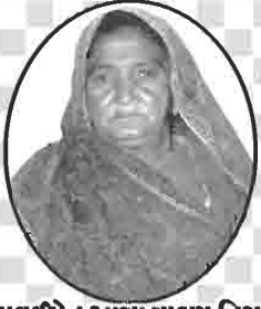
પાલકબેન આસા માડણ નિસર